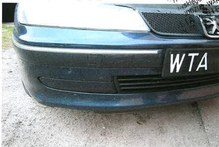
Pęknięty zderzak przedni.