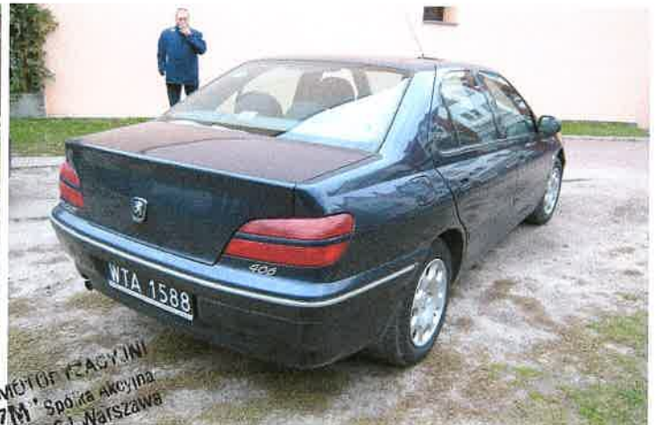
Widok tył z prawej strony.