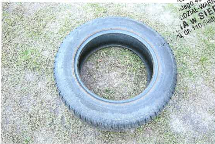
Opona Dębica Frigo directional 195/65 R 15 91T M+S