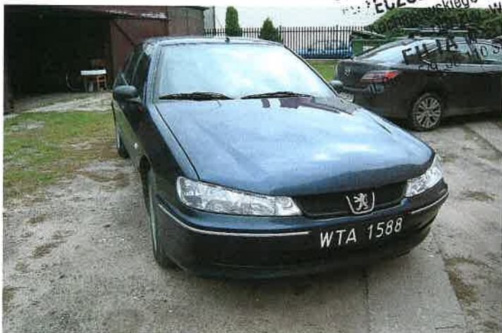
Widok przód z prawej strony.