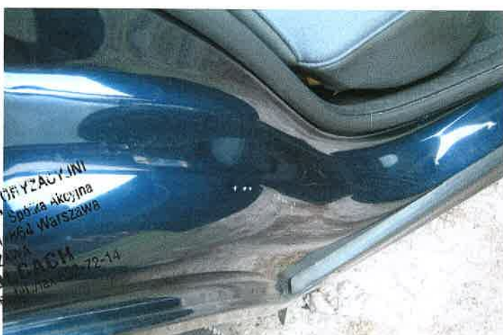
Nadkole wewnętrzne prawe.