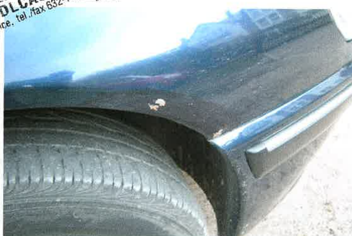
Blotnik przedni prawy.