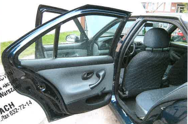
Widok - wnętrze od tyłu.

CENY-MOTOK WICY-PZM niego 45/5 01-86 DDZIAŁ-WARSZAWA IA W SIEDLCACH 9, 08-110 Siedlce, tel./fax 632-72-14