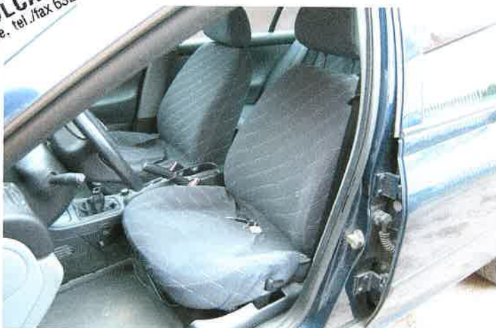
Widok - wnętrze od przodu.