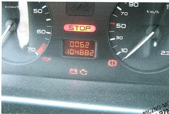
Wskazania przebiegu pojazdu.