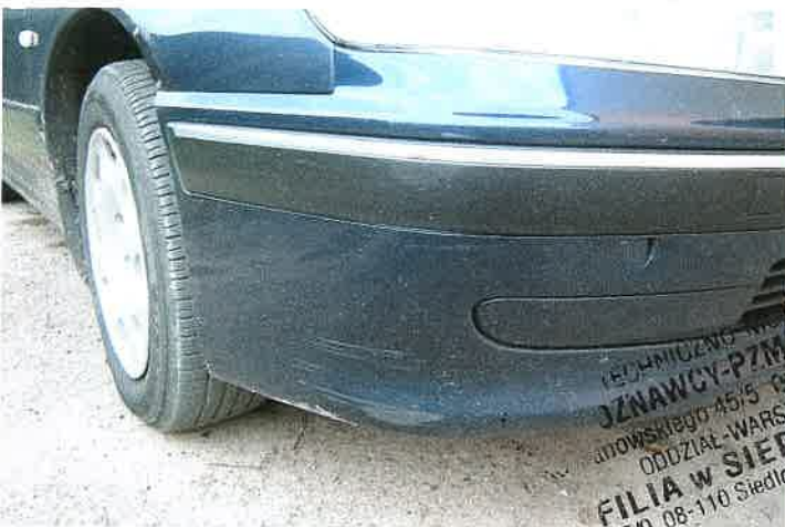
Zarysowana listwa ozdobna prawa zderzaka przedniego.