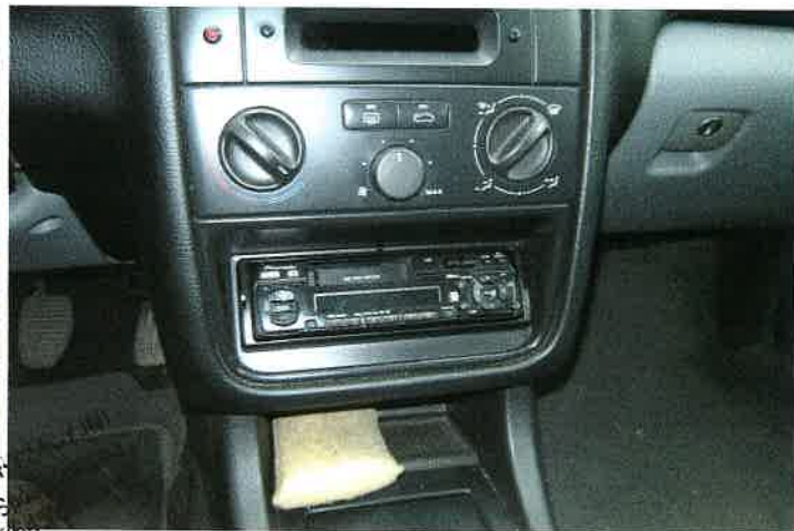
Radioodtwarzacz Pioneer KEH