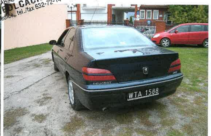
Widok tył z lewej strony.