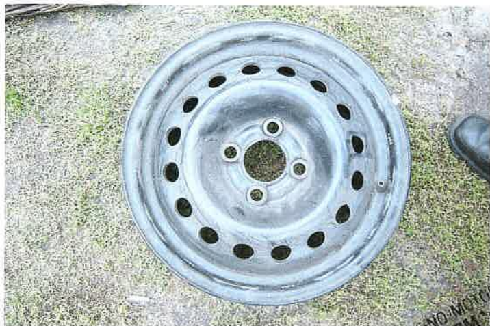
Dodatkowa tarcza koła.